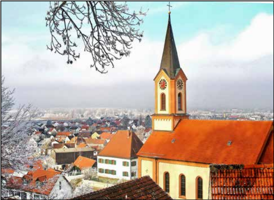
Winter über Jedesheim

Der Vorstand des SV Jedesheim wünscht allen Mitgliedern, Freunden, Unterstützern und Sponsoren eine gesegnete Weihnacht und ein gutes Neues Jahr, vor allem Gesundheit, viel Erfolg, aber auch viel Spaß beim Sport.