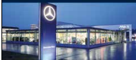
Autohaus Mack Senden

Frankfurt-Lair Str. 9 Tel. 0 73 07 94 94 - 0 www.autohaus-mack.de Öffnungszeiten: Mo-Fr: 9.00 - 18.00 Uhr Sa: 8.00 - 14.00 Uhr